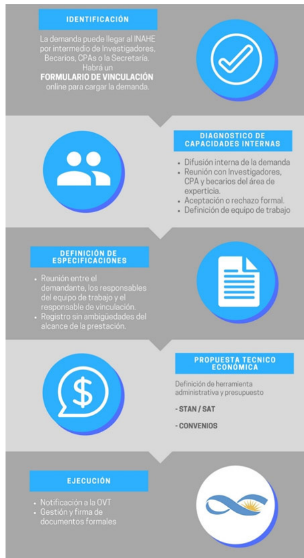
Figura 3: Infografía del Protocolo de Vinculación, utilizada para la difusión entre investigadores.

Para complementar su debida implementación, se elaboraron además una serie de soportes online utilizando herramientas institucionales o de acceso libre, que incluyen una pestaña «Vinculación y servicios» en la web del instituto, un formulario de solicitud de servicio, y la difusión interna de la demanda mediante e-mail. Durante su uso, se inició la escritura de un documento con el fin de registrar de forma pormenorizada la experiencia adquirida en cada etapa, apuntando a la sistematización del proceso de vinculación institucional.