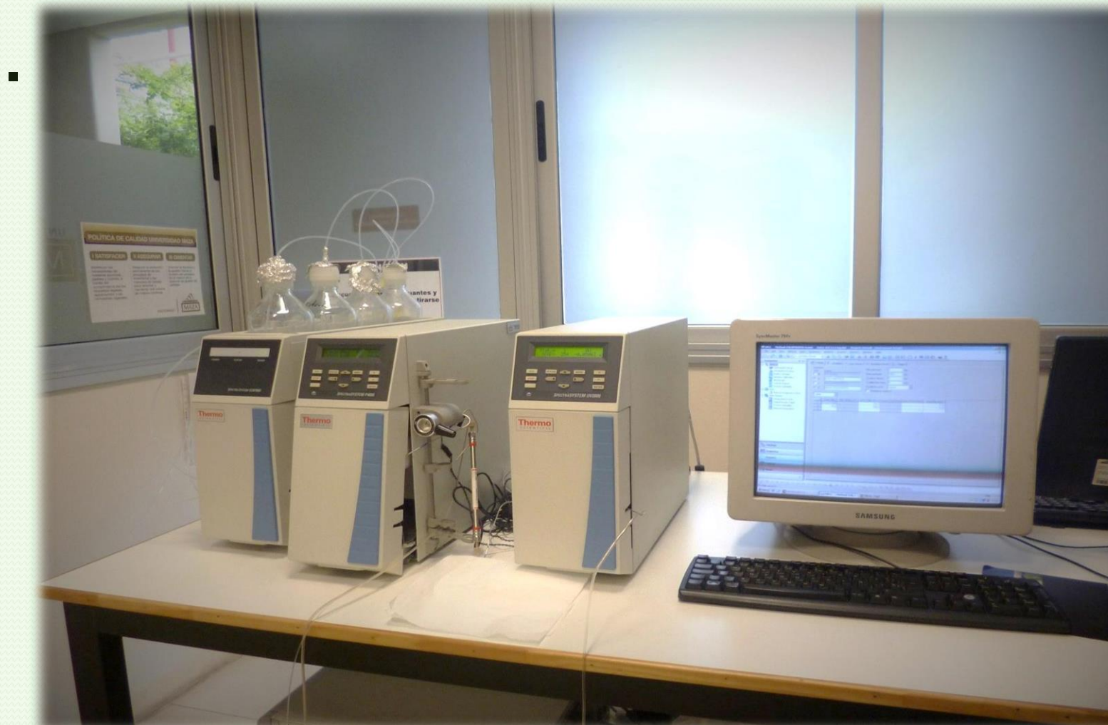
HPLC-UV Thermal scientific, LABORATORIO UMAZA

El objetivo del presente trabajo ha sido desarrollar y estandarizar un método mediante cromatografía líquida de alta precisión (HPLC) para poder analizar el insecticida en diferentes matrices biológicas.