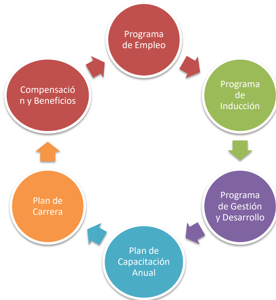
Figura 1. Sistemas de Gestión de Recursos Humanos- Este grafico indica los programas necesarios para la correcta gestión de Recursos Humanos, y se puede observar además que es un proceso imperecedero. Prof. Hernán A. Sagristá, Práctica Profesional.

Para poder llevar a cabo los aspectos nombrados anteriormente hay distintos pasos que permiten una gestión de recursos humanos óptima.