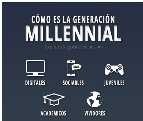
Figura 9. Características de los Millennials

Para tener más conocimiento de los Millennials hay que saber que algunas de las características (Figura 9) son: