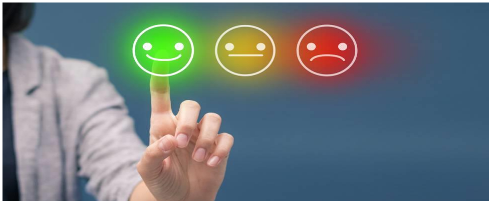
Figura 5. Motivación

6. Mayor lealtad. Uno de los mayores beneficios de tener empleados comprometidos es que son leales y unos excelentes embajadores. Recuerda, la imagen de una empresa comienza desde dentro.