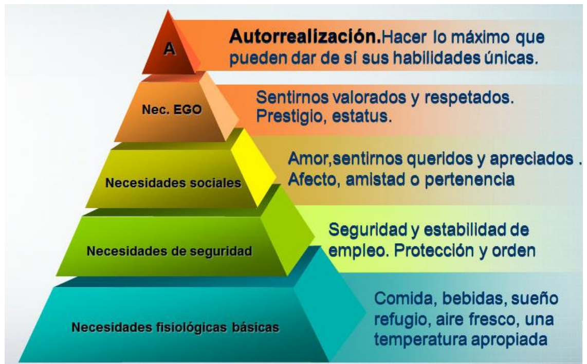
Figura 1. Pirámide de las necesidades de Maslow.

de la estructura se encuentran las necesidades sociales que son las de aceptación o pertenencia. Las necesidades de seguridad se encuentran en la cuarta posición que pueden ser la de estabilidad o las de evitar daños de algún tipo. Y por último en la quinta posición se entran las necesidades fisiológicas que son los alimento, vestimenta, etc. Determino que cualquiera de ellas requiere que su escalón inferior este cubierto para así poder activarse.