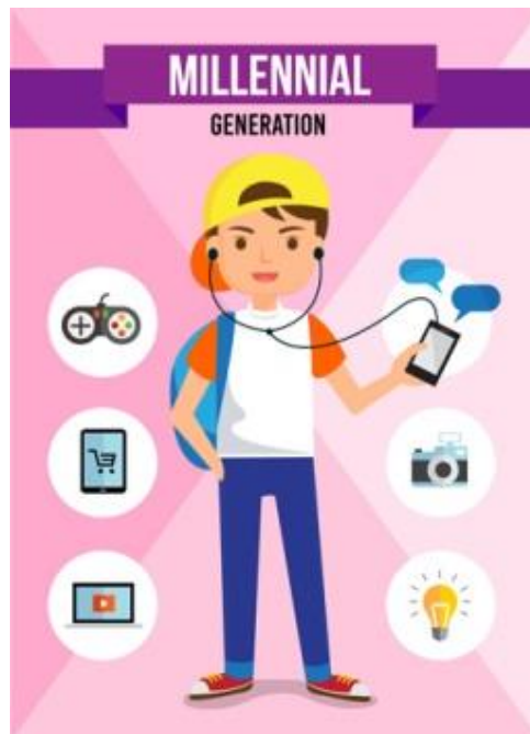
Figura 8. Generación Millennial .

Personas nacidas entre 1980 y 1999. Es una generación liberal desde el punto de vista familiar. Están actualmente entre los veinte y los treinta y poco años, son un grupo de importante consumidores actuales, que hacen que las estrategias de marketing tengan que actualizarse