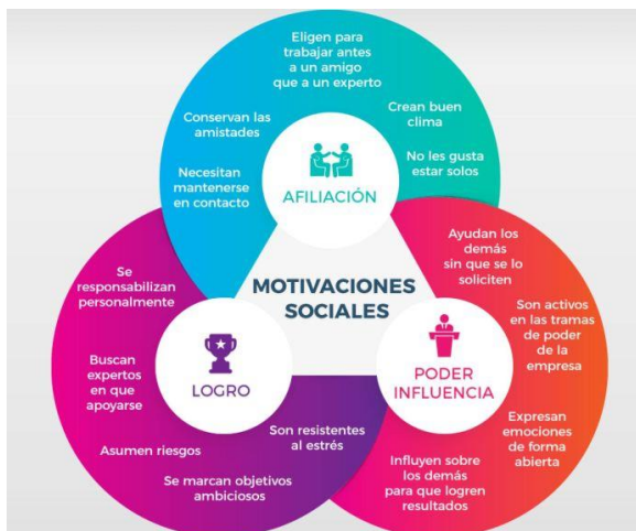
Figura 4. Teoría de las tres necesidades de McClelland.

Dotes de mando y liderazgo. Búsqueda de organización, efectividad y obediencia. Disfrutan de la responsabilidad, los altos cargos, tratan de influir en los demás y se preocupan más por lograr dichas influencias que por su propio rendimiento. El poder que buscan puede ser personal o institucional.