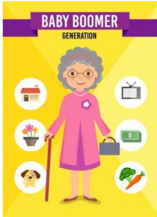
Figura 7. Baby Bombers.