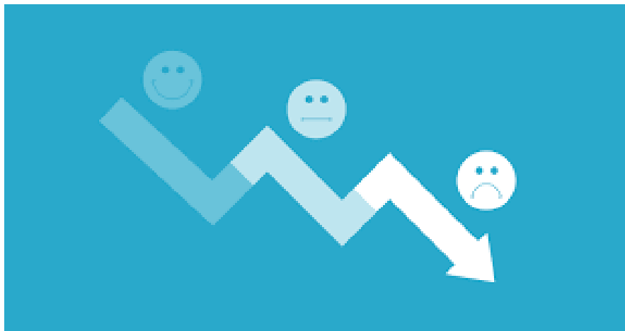
Figura 2. Desmotivación laboral.

Puede generar daños importantes cuando aparece de forma recurrente y prolongada en la vida de una persona e incluso llegar a poner en riesgo la salud.