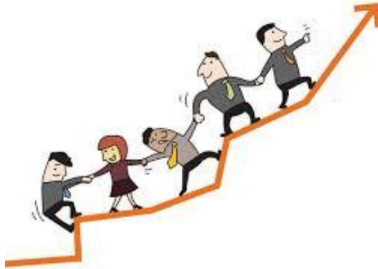
Figura 3. Motivación Laboral.

Es un gran tema dentro de cada organización, es un aspecto que nunca debe faltar con sus empleados, las empresas han notado su importancia y la influencia que tienen en los resultados. Supone un cambio cualitativo a la hora de realizar un trabajo, también como forma de mantener un ambiente agradable y proactivo.