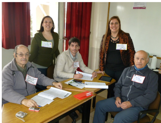
Imagen de su participación en el Café Científico de Investigación Educativa (2015)

Siempre que era invitado a algún evento científico, él inmediatamente se unía a la propuesta. Recuerdo cuando lo invité a colaborar en la Coordinación del Primer Café Científico de Investigación Educativa en las I Jornadas Internacionales de Investigación, Ciencia y Universidad y VII Jornadas de Investigación UMaza (octubre de 2015), le mandé mis primeras ideas y no tardó mucho en responderme, como acostumbraba, enriqueciendo a las mismas. Organizamos, entre otras actividades el juego del cadáver exquisito acerca de cuáles eran los fines de la investigación educativa. Además, propuso desarrollar uno de los Talleres de Ciencia para Científicos de dichas Jornadas, cuyo espíritu era el brindar capacitación en temas relacionados a la investigación científica y que fue llevado a cabo el 8 de octubre, en el cual habló de Herramientas digitales para la escritura académica y también expuso una comunicación oral en el Aula Magna de la UMaza sobre ¿Estudiante milenio en la universidad?